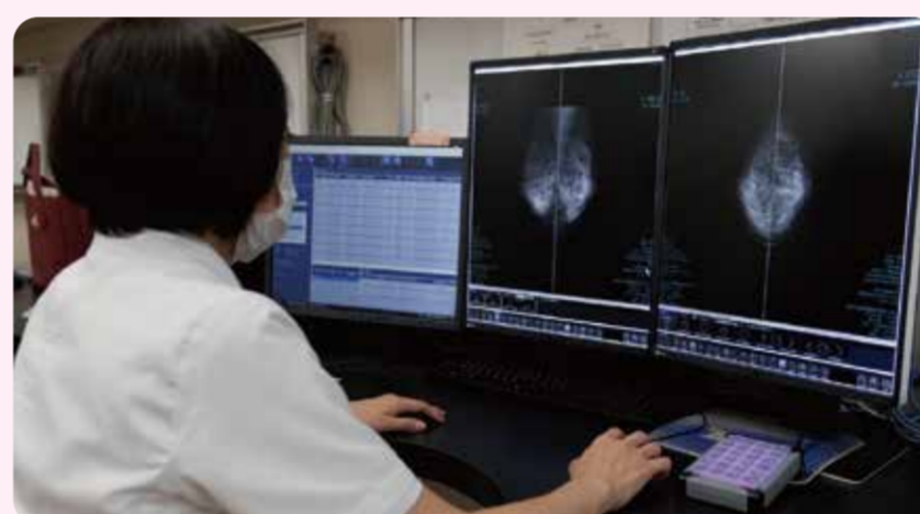
撮影した画像は専門の医師が診断を行います。